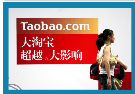
Le site Taobao, destiné aux particuliers est le quatorzième site le plus visité au monde et compte 500 millions d'utilisateurs enregistrés.